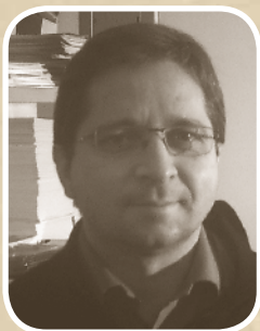
Pr Laurent Zelek

On estime communément que près d'un tiers des cancers est dû au mode de vie, en particulier l'alimentation mais également au manque d'activité physique. Ceci bien sûr sans que l'on tienne compte des cancers liés au tabac et à l'alcool. Plus récemment, l'attention s'est portée sur le devenir des patients guéris qui ont achevé le traitement de leur cancer. Intuitivement on imagine que ce qui est vrai pour empêcher la survenue d'un cancer doit aussi l'être pour empêcher sa rechute ! Il commence à exister des travaux scientifiques sérieux permettant de proposer des débuts de réponse à certaines questions.